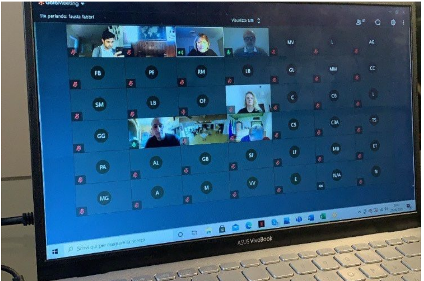
Hackaton Comunità del cibo

DI REDAZIONE · 22 APRILE 2021 · 64 VISITE